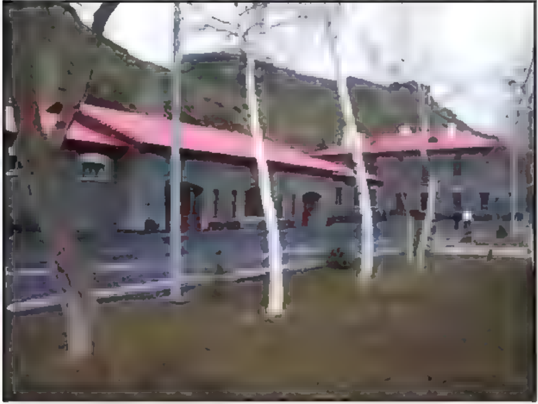
Kafkas Üniversitesi İktisadi ve İdari Bilimler Fakültesi